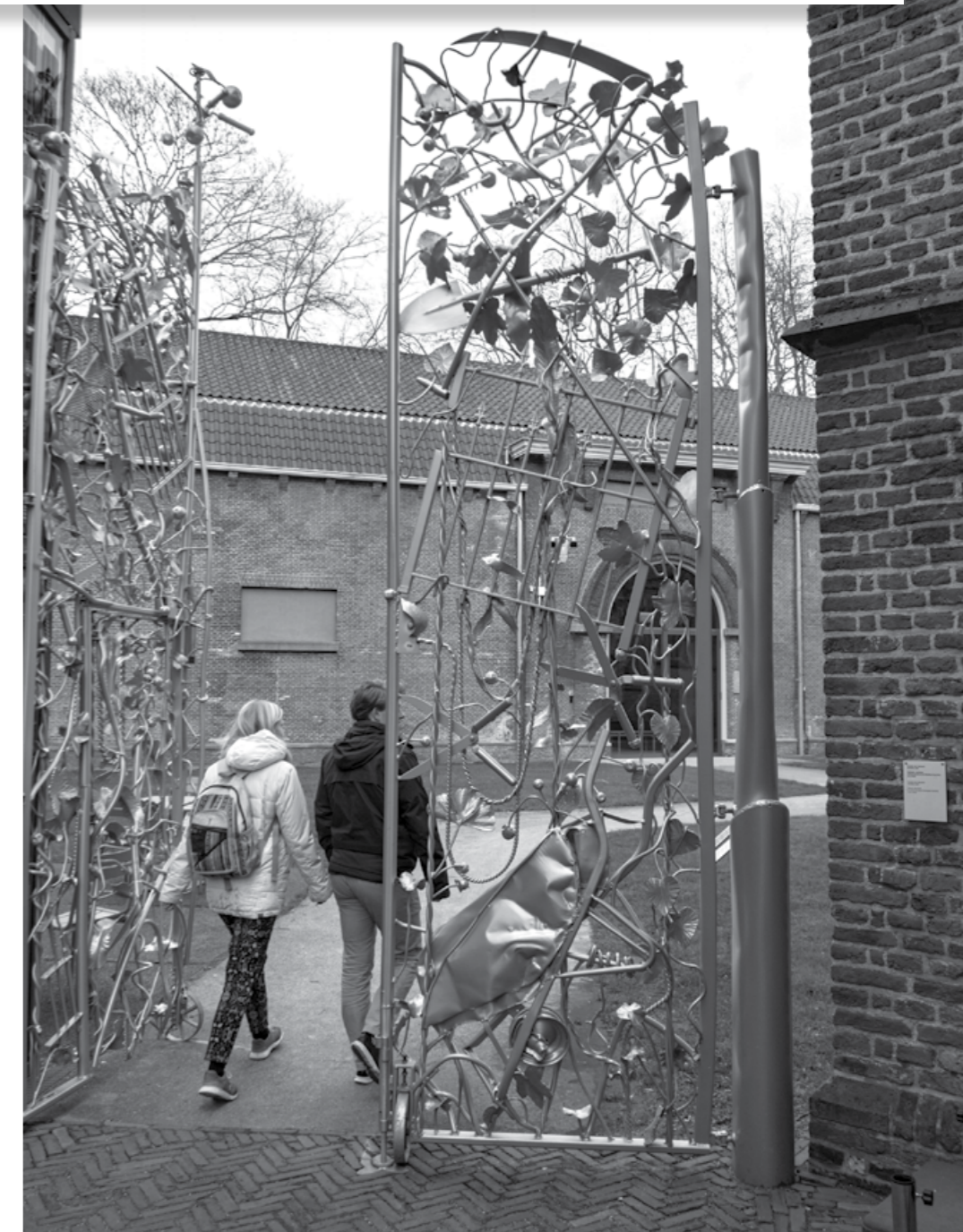
De tuin van het Centraal Museum is overdag toegankelijk voor publiek.

In de jaren 90 sloot de gemeente nog hofjes en stegen 's nachts af om hangjongeren, drugsgebruikers, wildplassers en inbrekers te weren. Deze eeuw koos ze voor handhaving, verlichting en snoeien van beplanting.