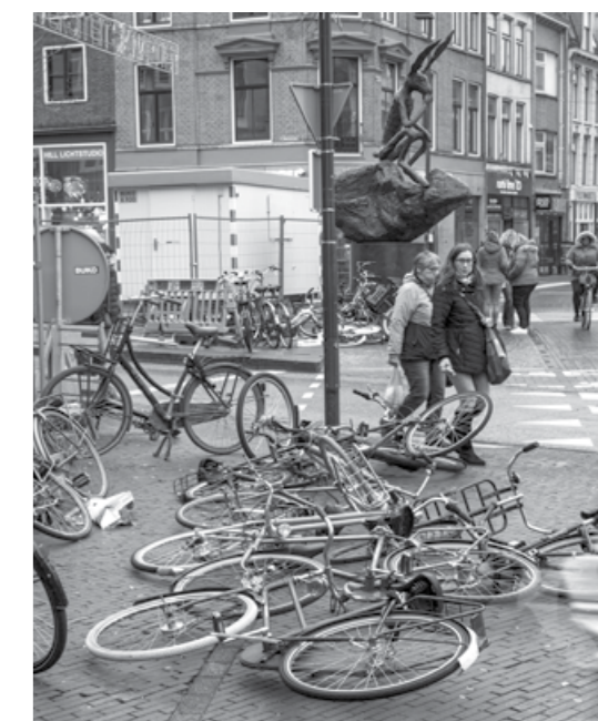
Soms bezetten fietsen hebbepig de openbare ruimte

bewaakte 'pop-up'-stallingen. Fietsen die de doorgang voor voetgangers belemmeren of gevaarlijk staan (nooduitgangen, blindengeleidestroken) worden altijd verwijderd. En 1 mei start een proef met het weghalen van fietsen op parkeerplaatsen voor invaliden, taxi's en op laad- en losplaatsen. Dagelijks wordt er gecontroleerd, vooral in het Stationsgebied. Fietsen die in overtreding zijn worden losgeknipt en meegenomen naar het fietsendepot. En af en toe wordt een weefsiets-actie gehouden. De gemeentelijke fietsparkeercontroleurs kunnen niet overal tegelijk zijn en alle gevaarlijk geparkeerde of onbeheerde fietsen aanpakken, maar iedereen kan een melding doorgeven (www.utrecht.nl/melding). En ten slotte mogen we blij zijn dat de fiets zo ongelooflijk populair is - geen luchtvervuiling, gezonde beweging en per saldo weinig ruimtebeslag, ondanks alle parkeerhinder en -overlast. •