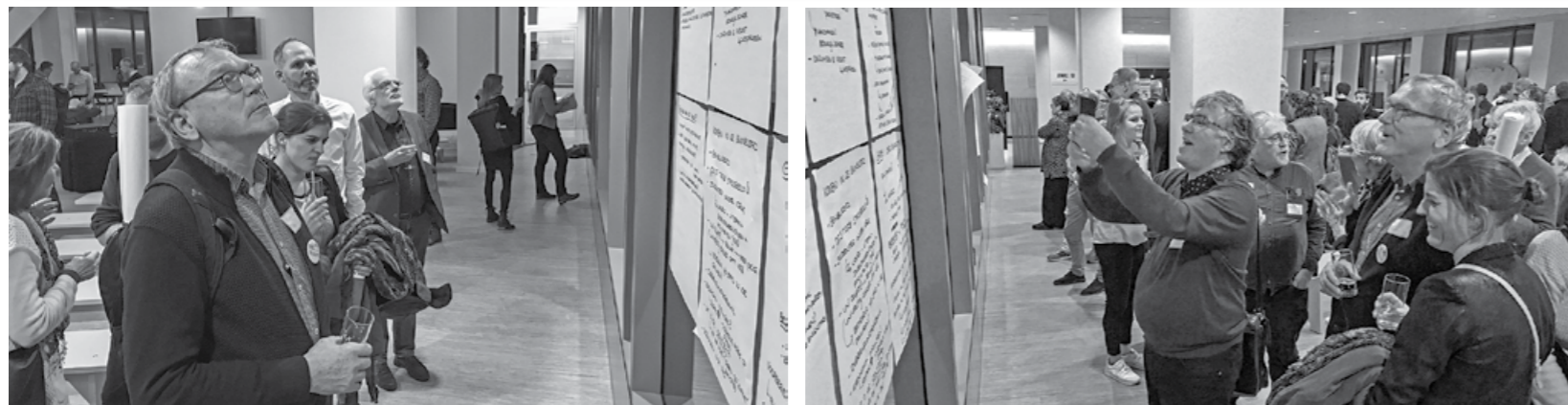
Op de eerste bijeenkomst over de visie op Utrecht in 2040 waren veel mensen aanwezig

De Binnenstad praat druk over de zogeheten Omgevingsvisie. De gemeente betreft zoveel mogelijk mensen bij het denken over het centrum in 2040. Hoe wonen, werken, winkelen we dan? Hoe zit het over 20 jaar met uitgaan, verkeer, groen, duurzaamheid, gezondheid, leefbaarheid? Als de visie is vastgesteld, worden toekomstige projecten daaraan getoetst.