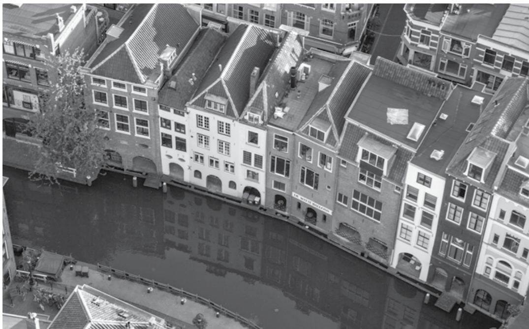
Het gemiddelde cijfer voor wonen in de Binnenstad is een 8. Van ondernemers mag 't er best wat drukker worden

Kleuver roept de gemeente dan ook op bijvoorbeeld via het wijkbureau de overeenkomsten te vinden tussen bewoners- en ondernemersbelangen. Via de wijkraad, waarin beiden vertegenwoordigd waren – kan dat immers niet meer. Om toch een beeld te krijgen van de beleving van de Binnenstadbewoner heeft CMU onderzoek laten