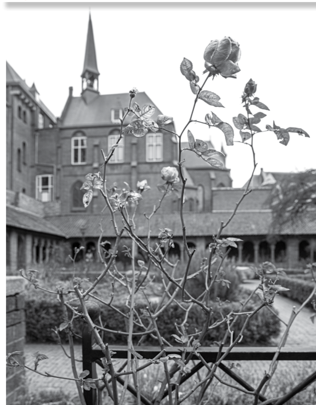
Vrijwilligers hebben van de Pandhof Sinte Marie iets moois gemaakt

In het Pandhof Sinte Marie is de lente begonnen. Tussen het groen bloeien al hier en daar longkruid, maagdenpalm en lenteklokjes. Het is een fraaie tuin, met wel zo'n 300 zorgvuldig uitgekozen historische plantensoorten. Een werkgroep heeft zich jaren geleden ontfermd over de tuin en zorgt sindsdien voor het onderhoud.