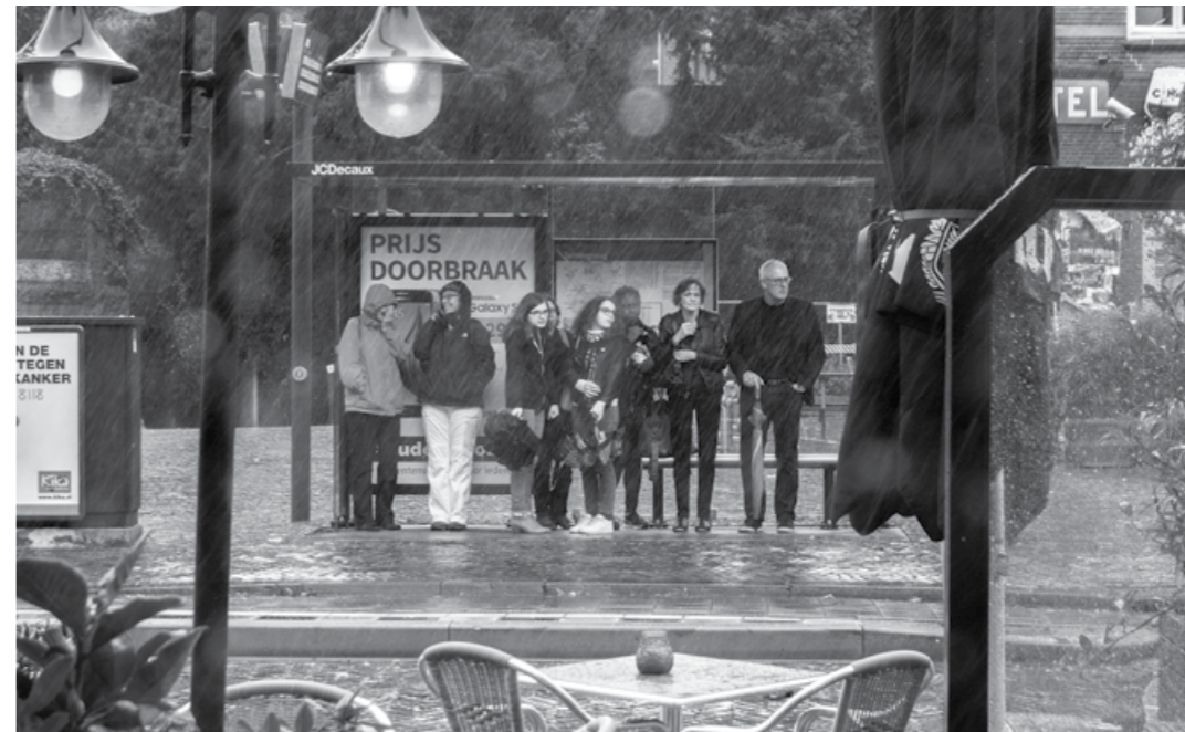
Plan is om de bushalte op het Ledig Erf te verplaatsen

loopafstand tussen halte Nicolaaskerkhof en Ledig Erf is minimaal.' Maar hij verwacht dat de overlast op de Wijde Doelen gering zal zijn. 'Auto's moeten even wachten, kunnen zich er niet meer langs wurmen, zoals bij de huidige halte wel vaak gebeurt. En sinds de stoplichten bij de brug grotendeels uitgezet zijn is de doorstroom naar en op het Ledig Erf al een heel stuk verbeterd.' Maar met de verplaatsing van de halte naar hun straat is de actiegroep evenmin blij. De straat verwacht meer stilstaand verkeer, vooral in de ochtend als de vrachtauto's de stad binnenkomen. •